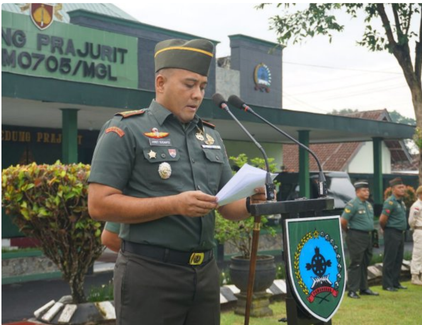
(Foto Dokumen) : Dandim Magelang saat membacakan amanat Pangdam IV/Diponegoro

MAGELANG - Kodim 0705/Magelang menggelar Upacara 17-an bertempat di